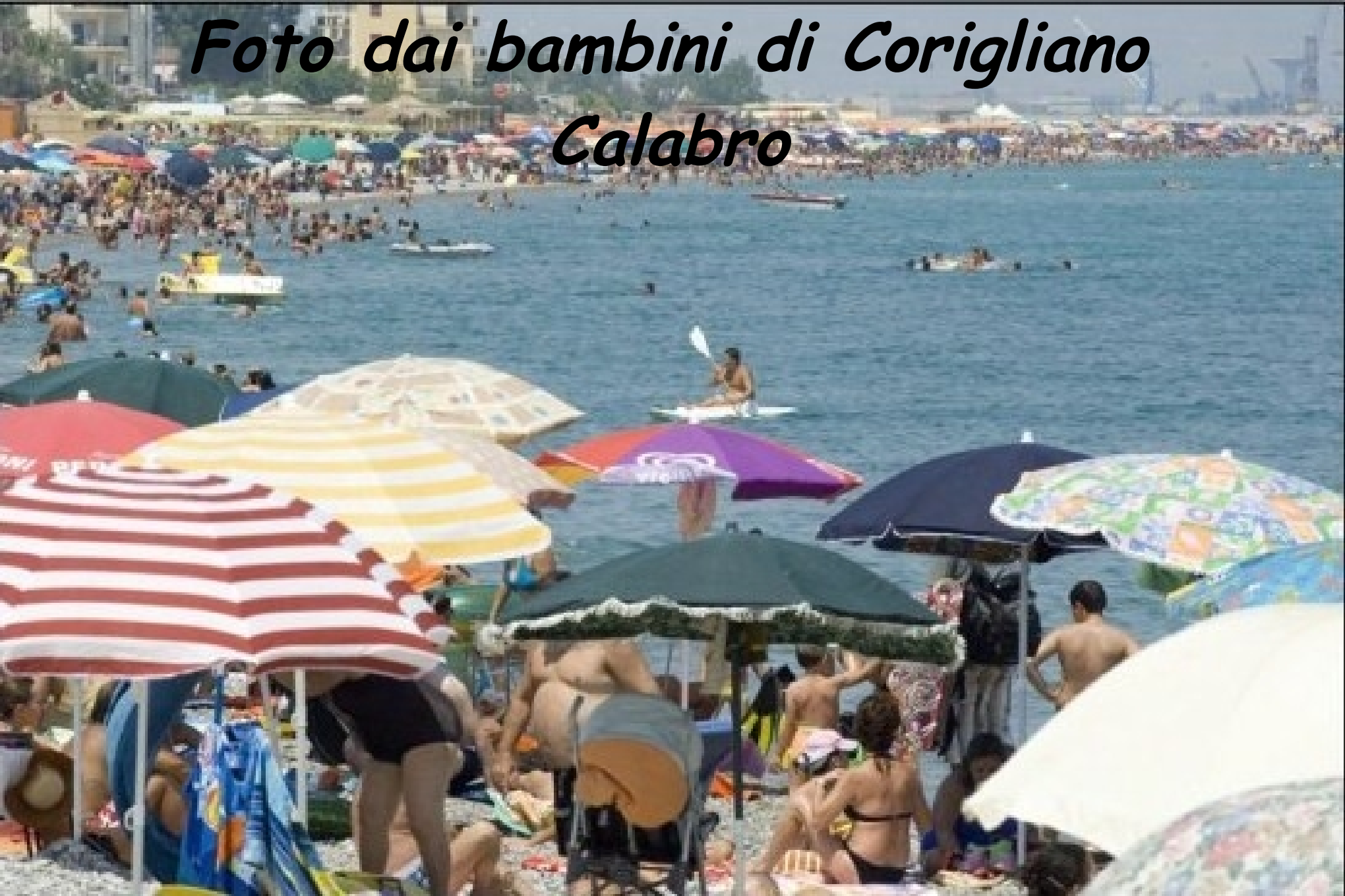
Foto dai bambini di Corigliano Calabro