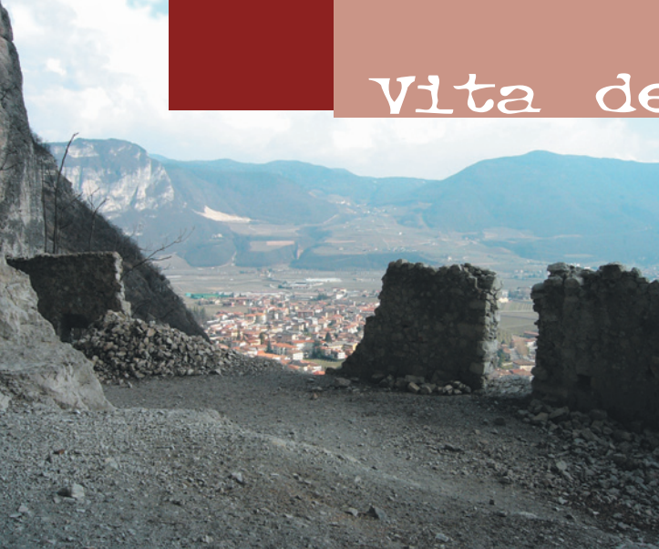
L'uscita sul territorio: in primo piano i ruderi del Castello di San Gottardo (Mezzocorona, Trento).

lavoro appositamente costruite ad uso didattico.