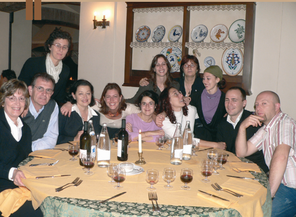
5. Alla cena sociale erano presenti anche molti rappresentanti dell'AIIGiovani.

dell'Ambiente e della Tutela Ambientale e con il Ministero per i Beni e le Attività Culturali.