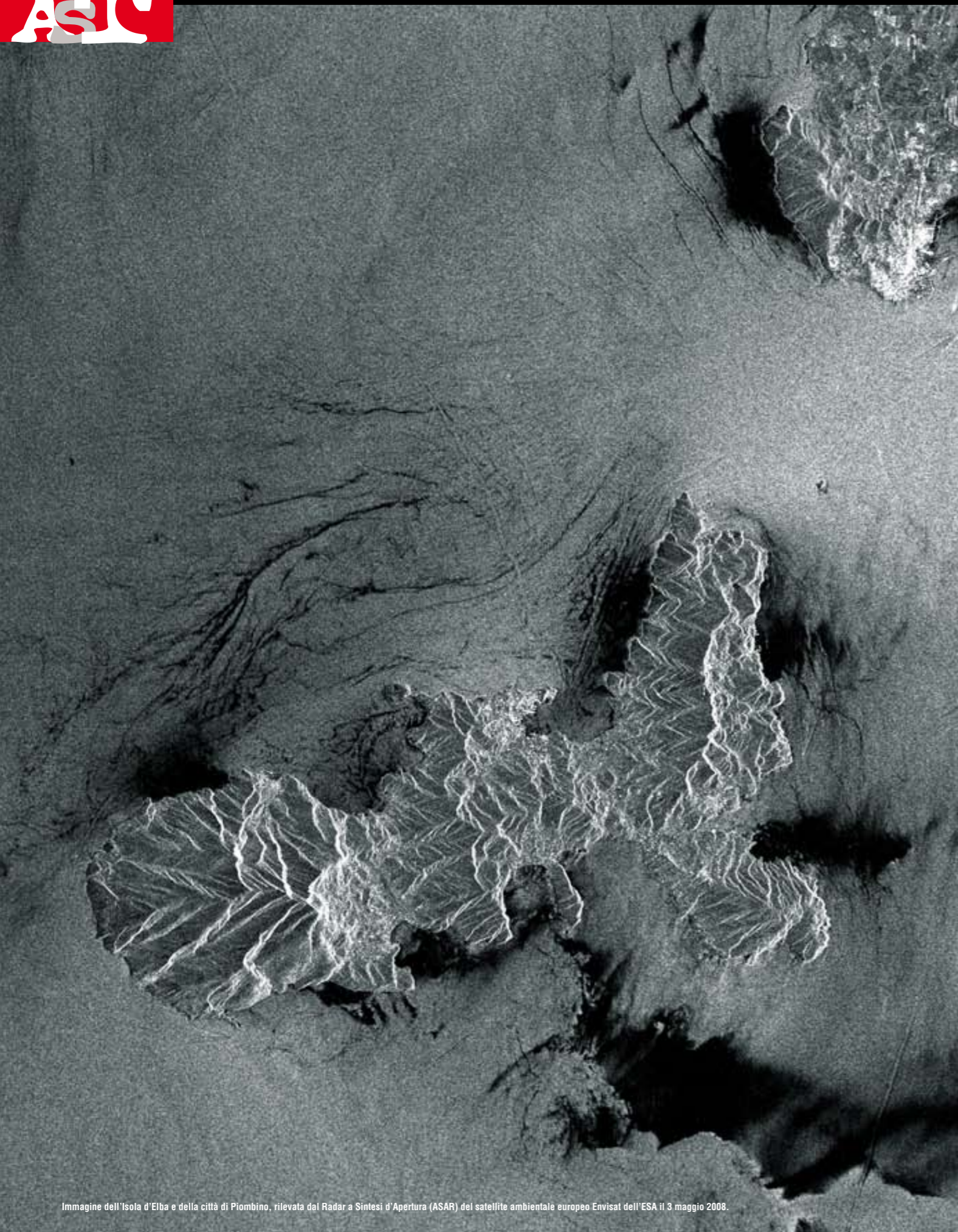
Immagine dell'Isola d'Elba e della città di Piombino, rilevata dal Radar a Sintesi d'Apertura (ASAR) del satellite ambientale europeo Envisat dell'ESA il 3 maggio 2008.