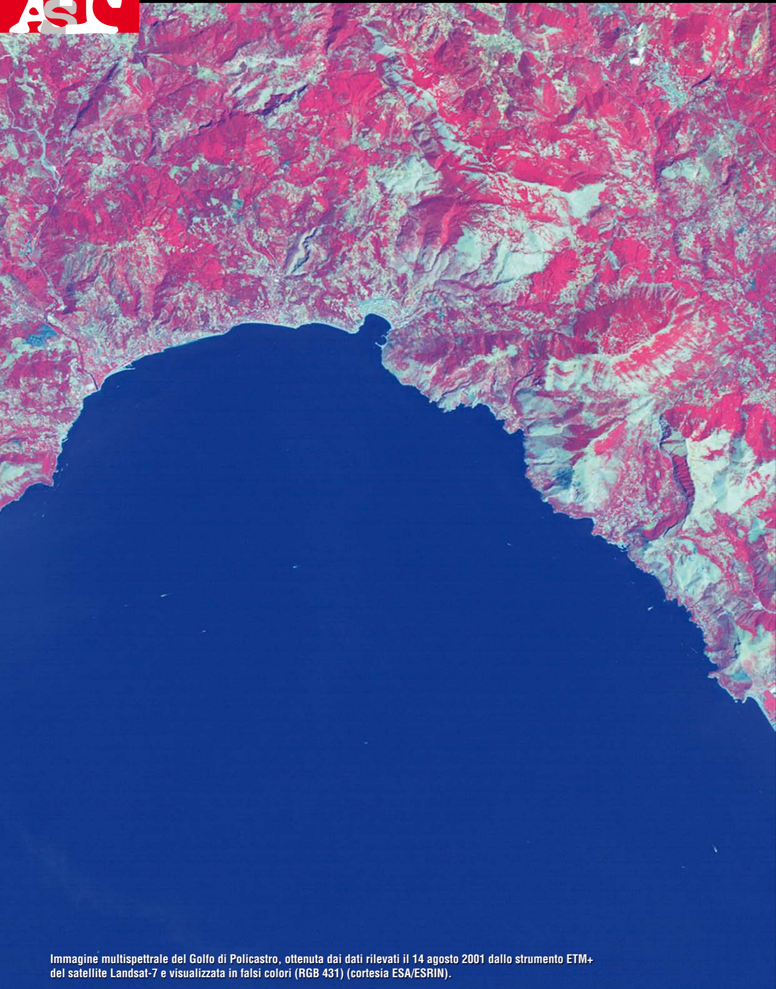
Immagine multispettrale del Golfo di Policastro, ottenuta dai dati rilevati il 14 agosto 2001 dallo strumento ETM+ del satellite Landsat-7 e visualizzata in falsi colori (RGB 431).