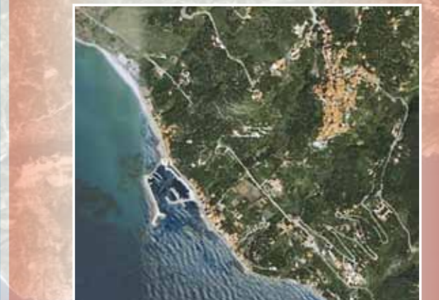
Fig. 7 - Il centro di Pisciotta, la marina e il porto turistico rilevati dal satellite GeoEye.