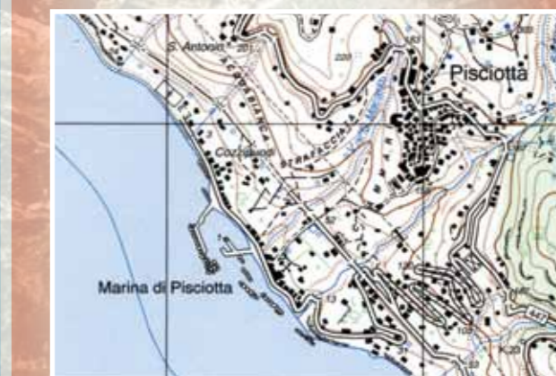
Fig. 6 - Pisciotta, la marina e il porto turistico, particolare del F. 519 sez. I - Ascea - serie 25 della Carta topografica d'Italia, IGM, 1998 (cortesia DADAT, sez. geografia).