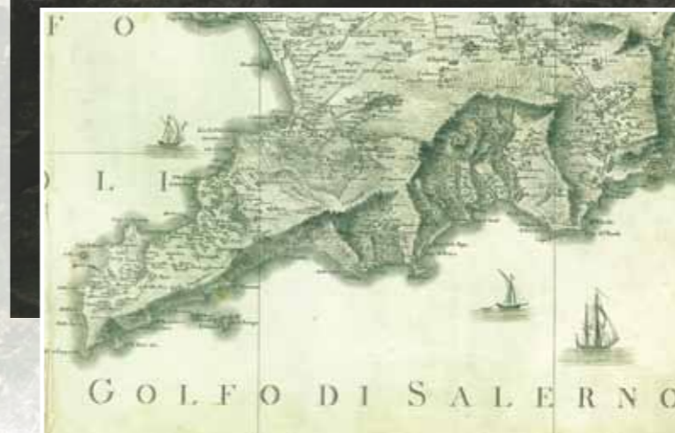
Fig. 1 - La Penisola Sorrentina, particolare del Foglio 14 dell' Atlante Geografico del Regno di Napoli di G. A. Rizzi Zannoni, 1788 -1812.

Gli ingrandimenti dell'immagine di copertina sulla Costiera Amalfitana (Fig. 3) e di quella rilevata dal satellite GeoEye sul porto di Salerno (Fig. 4) e l'analisi dell'ampliamento delle strutture per il diportismo nautico nel Cilento, secondo quanto emerge dalle carte IGM e da Google Earth (Figg. 5, 6 e 7), evidenziano le profonde differenziazioni che connotano i litorali della provincia.