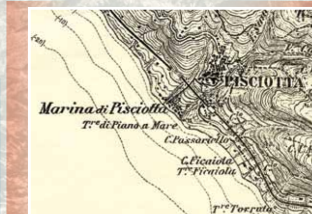
Fig. 5 - Pisciotta e la sua marina, particolare del F. 209 II NO - Pisciotta - serie 25V (ingrandimento della levata al 50 mila) della Carta topografica d'Italia, IGM, 1908.