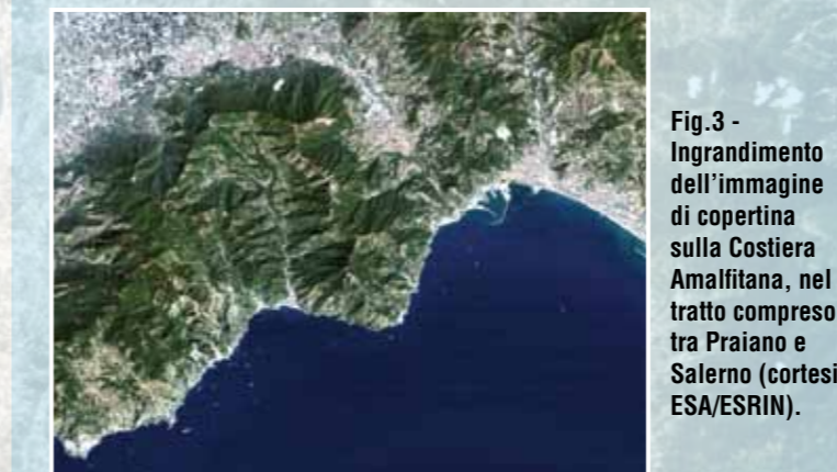
Fig. 3 - Ingrandimento dell'immagine di copertina sulla Costiera Amalfitana, nel tratto compreso tra Praiano e Salerno (cortesia ESA/ESRIN).