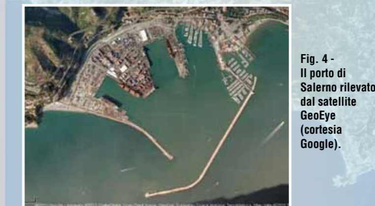
Fig. 4 - Il porto di Salerno rilevato dal satellite GeoEye.