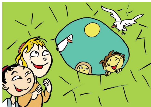
Fig. 3. Incredibile: si trattava proprio di altri bambini (scoperta di similarità).

Era vero: nessuno aveva ascoltato veramente i racconti, tutti avevano semplicemente deciso che non potevano essere veri, perchè erano diversi dalle storie che loro conoscevano. Allora gli uccellini decisero di dimostrare a quei bambini che in realtà non erano poi così diversi e proposero di giocare tutti insieme, con delle squadre miste. Passarono così una