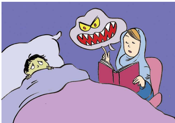
Fig. 2. Ognuno immaginava l'altro come di solito si immaginano gli orchi delle favole: cattivi, brutti e sempre pronti a fare del male (costruzione di stereotipi sullo sconosciuto "altro").

Si racconta, però, che un mattino che sembrava uguale a tutti gli altri, svegliandosi, gli abitanti dei due paesi rimasero senza parole e alcuni pensarono addirittura di non essere riusciti a svegliarsi del tutto.