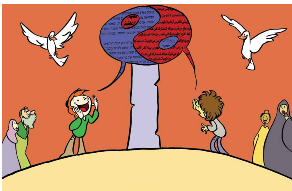
Fig. 5. Bisognava ascoltare e far ascoltare agli altri le proprie storie (importanza della narrazione e della dimensione dell'ascolto reciproco, condivisione di storie e di luoghi).

E, quando i bambini ebbero finito, prese la parola una mamma da un lato, poi un papà dall'altro, fino a che tutti ebbero raccontato le loro esperienze, belle o brutte, recenti o avvenute molti anni prima.