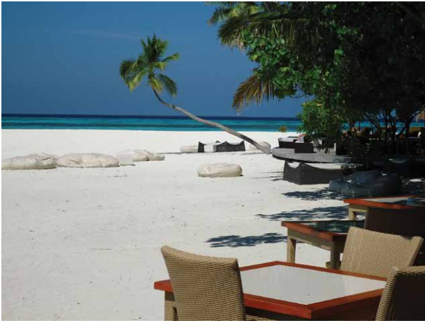
Fig. 2. Spiaggia di resort maldiviano (Foto dell'autore).