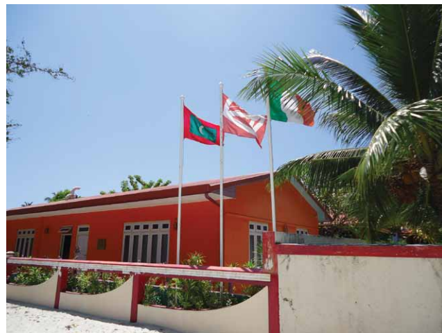
Fig. 10. L'outpost Bicocca a Magoodhoo.

Accanto alle attività in campo biologico, si segnalano le ricerche di antropologia, i corsi di