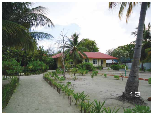
Fig. 12. L'interno dell'outpost Bicocca: la foresteria.