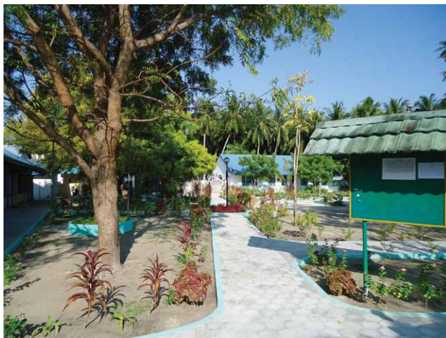
Fig. 8. Il giardino della scuola di Magoodhoo

Magoodhoo è una delle cinque isole abitate dell'atollo di Faafu, localizzata a 3°04'40" N e 72°57'55 E, a 71 miglia a SSW da Male, ampia poco più di 40 ha (1.060 m di lunghezza e 380 di larghezza), con un reef esteso tre