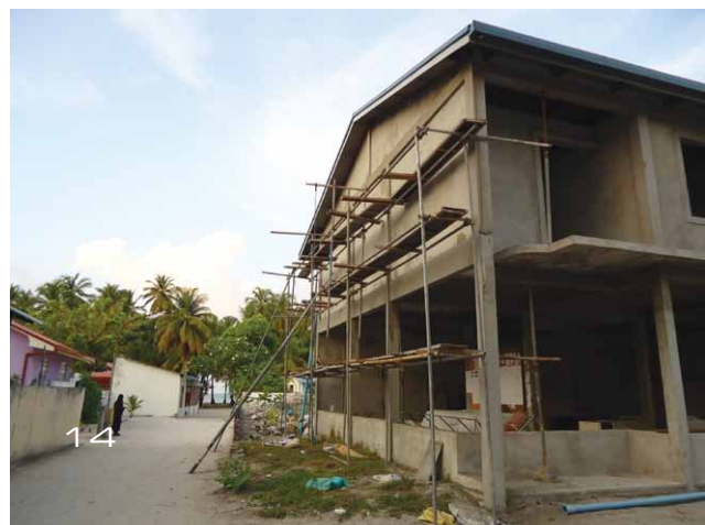
Fig. 14. La guesthouse di Magoodhoo in costruzione (Foto dell'autore).

Università di Milano-Bicocca, Dipartimento di Sociologia e Ricerca Sociale; Sezione Liguria