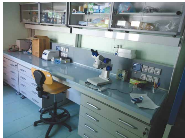
Fig. 11. Un laboratorio di biologia marina dell'outpost Bicocca (Foto dell'autore).