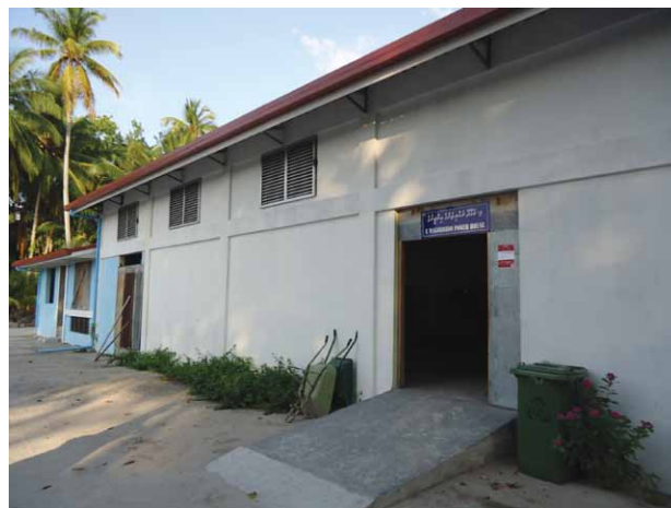
Fig. 5. Il generatore di energia termoelettrica di Magoodhoo.

Circa l'eventualità di moderare la separazione tra spazi per autoctoni e spazi per turisti, il piano di sviluppo turistico si dimostra ancora restio a lasciar sviluppare il turismo al di fuori dei resort . Tuttavia, una guesthouse è oggi in costruzione all'isola di Magoodhoo che dal 2011 è altresì sede di un outpost dell'Università di Milano-Bicocca.