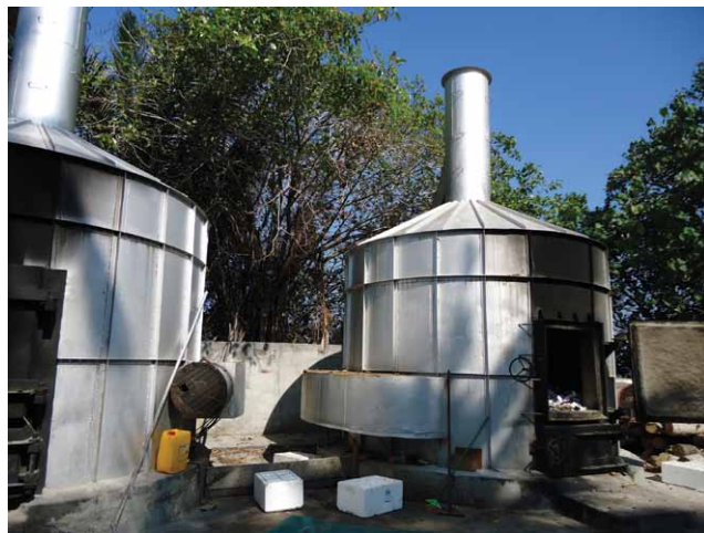
Fig. 6. L'inceneritore per rifiuti del resort Filitheyo.