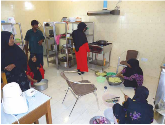
Fig. 13. Gruppo di donne di Magoodhoo preparano i pasti nella cucina dell'outpost Bicocca.

lingua italiana per gli abitanti di Magoodhoo, gli studi di geografia di genere e il workshop – organizzato dal Dipartimento di Sociologia e Ricerca Sociale, in collaborazione con quello di Biotecnologie e Bioscienze – di «Turismo sostenibile in ambienti fragili: sostenibilità e sviluppo in contesto insulare». Tale workshop , la cui seconda edizione si è svolta dal 20 al 28 febbraio 2013, è principalmente rivolto agli studenti dei corsi di laurea triennale in «Scienze del turismo e comunità locale» e magistrale in «Turismo, territorio e sviluppo locale» di Milano-Bicocca, ma non si preclude a studenti di altri corsi o atenei, o addirittura a professionisti del settore.