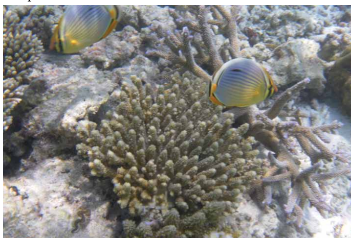
Fig. 1. Fondale delle Maldive.

La storia contemporanea dell'arcipelago è caratterizzata dai discussi regimi personali instaurati dai successivi presidenti. Nonostante vi siano ancora gravi violazioni dei diritti umani – si ricordino per esempio le cento frustate comminate il 9 gennaio 2013 a una quindicenne (cfr. quotidiani del 1° marzo 2013) – le Maldive occupano le prime pagine dei giornali perlopiù per i temi ambientali. Nel 1998 si parlò a lungo dei danni arrecati al reef «sbiancato» dal Niño che aveva surriscaldato le acque dell'oceano; nel 2004 delle 108 vittime provocate dallo tsunami che da Sumatra