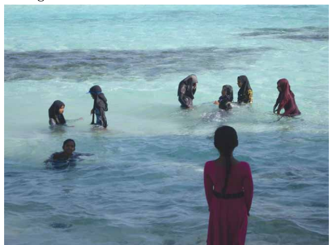
Fig. 9. Bambine al bagno di sabato.

Il municipio, oltre a ospitare gli uffici degli impiegati – che in orario di lavoro hanno l'obbligo di indossare la cravatta – è sede delle riunioni del «Consiglio dell'Isola», composto, oltre che dal «Capo dell'Isola», da cinque membri che dal 2010 sono eletti a suffragio universale per un mandato quinquennale, mentre prima di allora erano di nomina presidenziale. Sebbene l'elettorato passivo sia anch'esso universale, è raro che alle Maldive una donna venga eletta, sicché sull'isola assume importanza il «Comitato Donne», una sorta di patronato fondato nel 1976 come comunità agricola e cooperativa di acquisto e di consumo, che adesso si fa soprattutto interprete delle esigenze delle donne dell'isola. Per esempio è grazie al suo interessamento che nel 1988 a