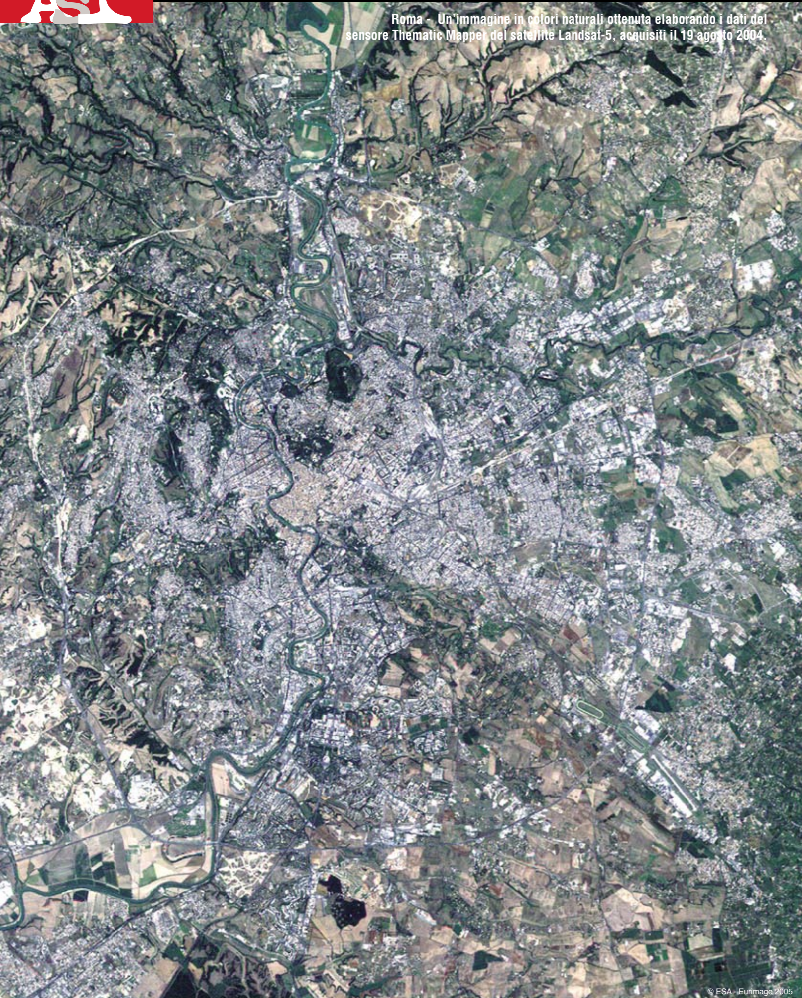
Roma - Un'immagine in colori naturali ottenuta elaborando i dati del sensore Thematic Mapper del satellite Landsat-5, acquisiti il 19 agosto 2004.